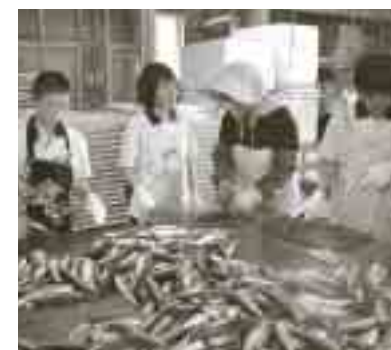
中学生の加工場体験学習

6月だというのに梅雨らしきもなく今年の夏はどんな夏になるかと心配していましたが、夏の風物詩であるトビウオが武良の海へ戻ってきました。今年は6月だけで約20万尾以上の水揚げで、昨年を大きく上回る出荷量となり、武良中がアゴだらけで活気づきました。トビウオは南方から日本海に入ってきて、6月〜8月ころまで隠岐近海にも来遊して沿岸域で産卵します。武良で捕れた新鮮なトビウオは大半がダシの素として加工されています。内蔵を取り除いてから煮て乾燥されたアゴだしは、風味があり上品な味わいに仕上がって、昔から全国のファンに重宝されています。