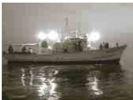
体験漁業船「あいらんど号」

いよいよ夏到来です。夏の風物詩といえば数々ありますが、今回ご紹介するのは「白いか釣り」です。 奥津戸漁港には、体験漁業船「あいらんど号」(19t)があります。定員12名、トイレにベットまで装備しています。この船で、「白いか釣り」を体験できます。 新鮮な刺身をいかソウメンにしたり、持って帰って一夜干しにしたり：想像するだけでたまりません。 おまけに、道具は全て備え付けなので後は乗船するだけという気軽さ！ぜひ一度体験してみてください。