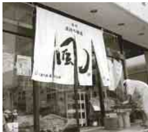
風待ちスタジオ・大きな暖簾（のれん）が目印です。