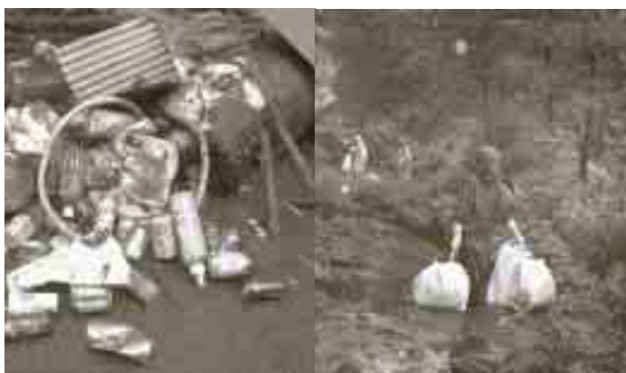
ごみ1トンを回収した都万目クリーン作戦

6月11日（土）、都万目地区を流れる中山川周辺のクリーン作戦が行われました。参加者は、都万目地区の皆さんと役場職員のボランティア約30名。冷たい雨が降りしきる悪条件の中、回収したのは大きな袋に80個、重さにして約1トンのごみ。内容は空き缶、ペットボトルなどの小さなものから家電などの大きなものまで様々でした。クリーン作戦は各地で行われていますが、どこも多くのポイ捨て、不法投棄のごみが多く回収されています。