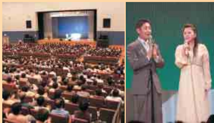
満員のレインボーアリーナ 盛り上がりました

6月24日(金)、レインボーアリーナに宮路オサム、夏川りみ、門倉有希の3人のプロ歌手を迎え、NHKラジオ「Cの散歩道」の公開録音が行われました。 「Cの散歩道」はNHKラジオ第1の番組で、歌手の出演による歌とおしゃべりの30分番組です。 当日、会場はほぼ満員の1500人の方が詰めかけ、プロの歌声に耳を傾けていました。