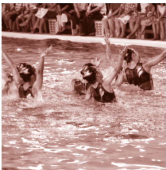
質の高い演技に会場は大満足