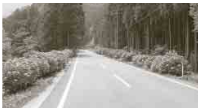
皆さんも一度ご覧下さい

布施地区内の国道485号線沿いに、数百メートルにわたり紫陽花が植えられています。 今年も色とりどりの花が咲きほこるこの道を、地区では「あじさいロード」と呼び、道路を通る私たちの心を和ませてくれます。 この紫陽花は、昭和57年のくにびき国体を記念し、公民館活動の一環として、老人クラブ等が中心となり植栽を行ったものです。植栽は数年にわたり続けられ、今ではその数は400本にもなります。