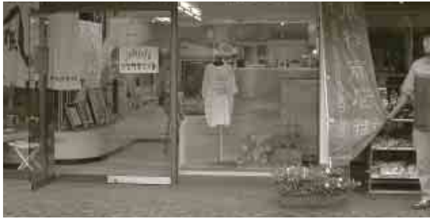
ジョブカフェしまね・隠岐サテライト

かつて風待ち港として賑わった西郷港付近の商店街は、近年の大型店舗の郊外進出や後継者問題等から空き店舗が増え、商店街としての雰囲気を感じつつあります。そこで、この空き店舗を利用して、商店街に活気を取り戻すべく、2つの事業がスタートしました。