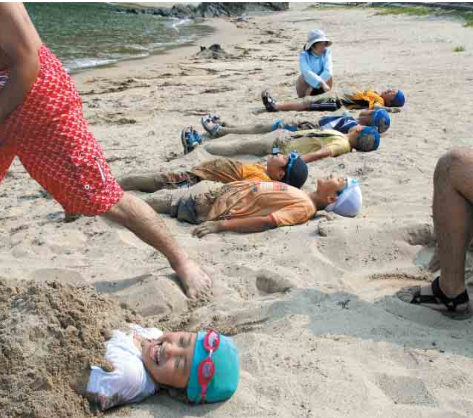
春日の浜海水浴場—ひと足先に海遊び