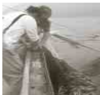
海面に飛んでいるアゴを二艘曳きの網で捕獲

6月だというのに梅雨らしきもなく今年の夏はどんな夏になるかと心配していましたが、夏の風物詩であるトビウオが武良の海へ戻ってきました。今年は6月だけで約20万尾以上の水揚げで、昨年を大きく上回る出荷量となり、武良中がアゴだらけで活気づきました。トビウオは南方から日本海に入ってきて、6月〜8月ころまで隠岐近海にも来遊して沿岸域で産卵します。武良で捕れた新鮮なトビウオは大半がダシの素として加工されています。内蔵を取り除いてから煮て乾燥されたアゴだしは、風味があり上品な味わいに仕上がって、昔から全国のファンに重宝されています。