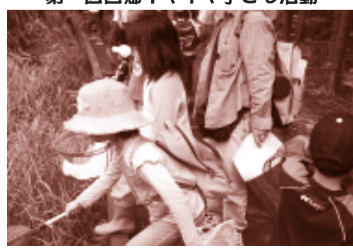
あ!おった~おったぞ~♪

恒例の、自然体験活動「第一回西郷イキイキ子ども活動」(西郷地域まちづくり運動協議会・隠岐の島町子ども会連絡協議会・西郷公民館の共催)が、去る6月19日(日)に開催されました。