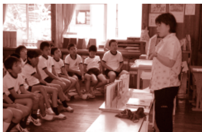
ブックトークの様子

毎月テーマに沿った本を紹介していきます。なお、前回より対象を4・5・6年生に絞って実施しています。楽しい本をたくさん紹介しますのでぜひお越しください。8月は6日(土) 午前10時30分から行います。