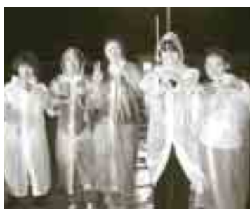
女性や子供でも大丈夫！船長が手伝ってくれます。

いよいよ夏到来です。夏の風物詩といえば数々ありますが、今回ご紹介するのは「白いか釣り」です。 奥津戸漁港には、体験漁業船「あいらんど号」(19t)があります。定員12名、トイレにベットまで装備しています。この船で、「白いか釣り」を体験できます。 新鮮な刺身をいかソウメンにしたり、持って帰って一夜干しにしたり：想像するだけでたまりません。 おまけに、道具は全て備え付けなので後は乗船するだけという気軽さ！ぜひ一度体験してみてください。